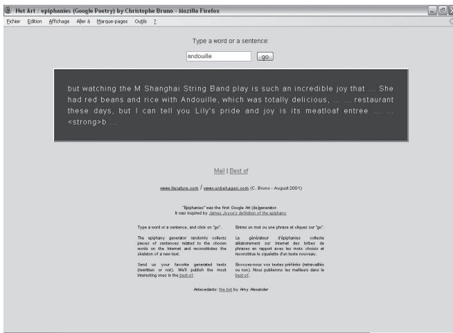
Fig. 1) formulaire de saisie (case blanche). Le texte généré apparaît dans la zone noire

Je reproduis dans l'Internet l'expérience de Joyce » dit Christophe Bruno. « Je considère en effet l'Internet comme un texte global , et j'y envoie un programme qui en rapporte des bribes de phrases, en fonction de ce que l'internaute va taper. Plus précisément, l'internaute saisit quelques mots sur une page de mon site, le programme va chercher des morceaux de phrases en rapport avec ces mots mais provenant de contextes différents, et cela reconstitue le squelette d'un autre texte.